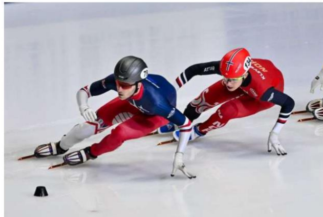
Utarbeidet av teknisk komite kortbane (mai 2025)